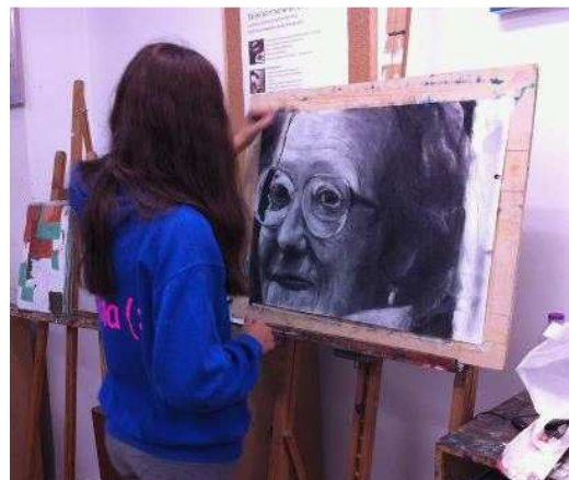
Alumna de 16 años aplicando técnicas del curso.

El proceso permite al alumno desarrollar la medida intuitiva hasta dominarla con facilidad, así como organizar el proceso de dibujo para obtener resultados equilibrados de encajado y claroscuro.